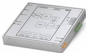
Le modulateur DVB-SH MSH-2000 de TeamCast

Pour plus d'information : www.teamcast.com