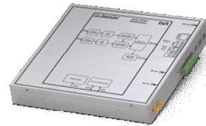
Le récepteur DVB-SH RSH-2000 de TeamCast