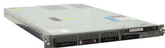
Le Manageur Réseaux IPE de UDcast